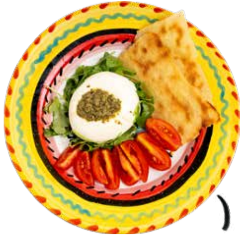
Burrata e Guttiau