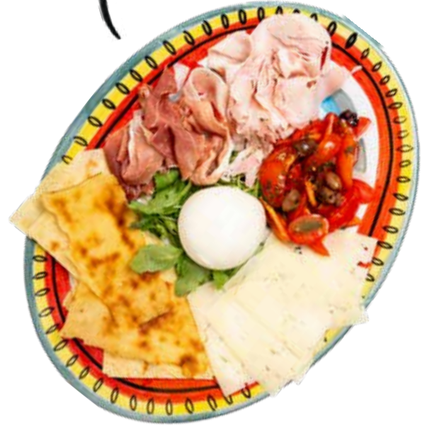
Dacci un tagliere!