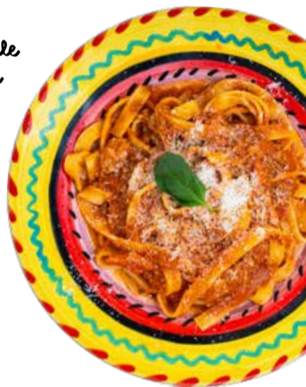
Tagliatelle al ragù

Suppléments Jambon cru 3€ - Burrata 3,5€ - Copeaux de truffe 4€