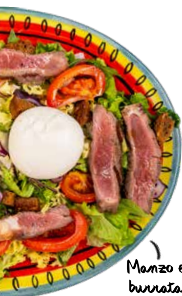
Manzo e burrata

Toutes les salades sont également disponibles avec notre vinaigrette à l'italienne, une émulsion d'huile d'olive extra vierge et de vinaigre balsamique