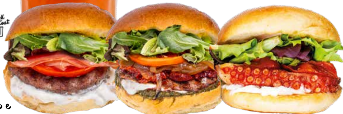
Crudo e stracciatella di burrata