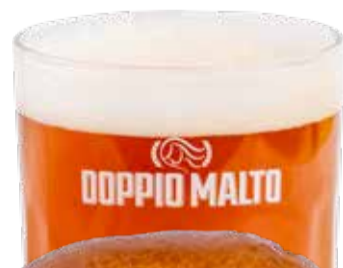
'Nduja e cipolla