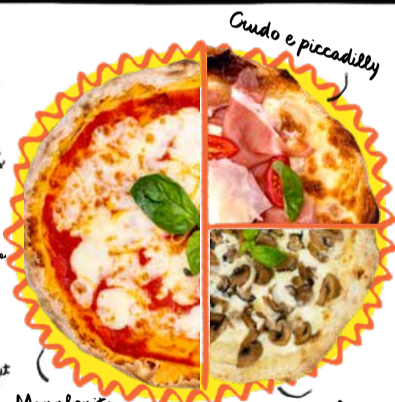
Margherita è bella