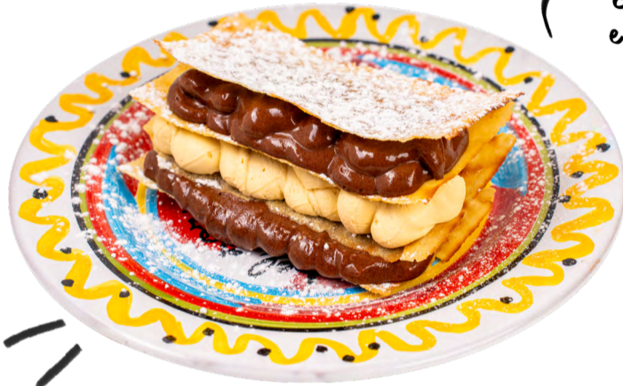
Millefoglie cioccolato e zabaione