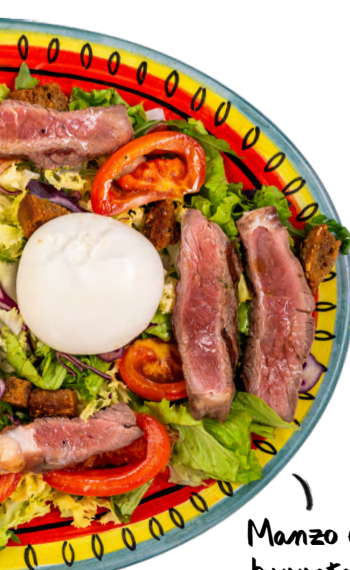
Manzo e burrata