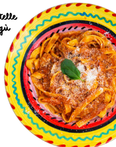
Tagliatelle al ragù