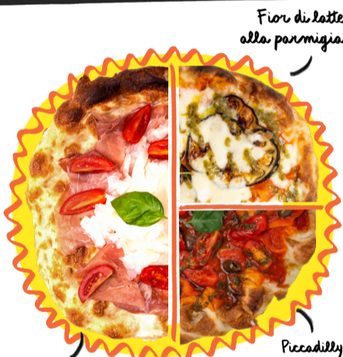
Fior di latte alla parmigiana