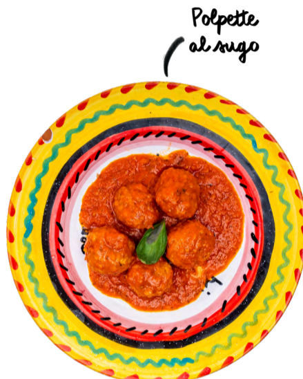
Polpette al sugo