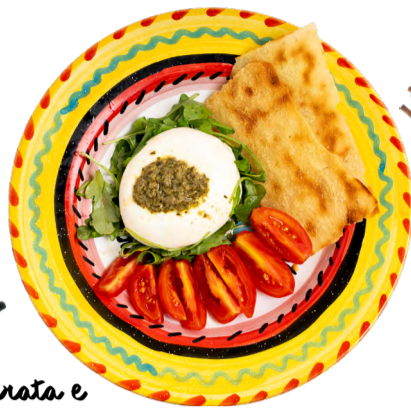
Burrata e Guttiau