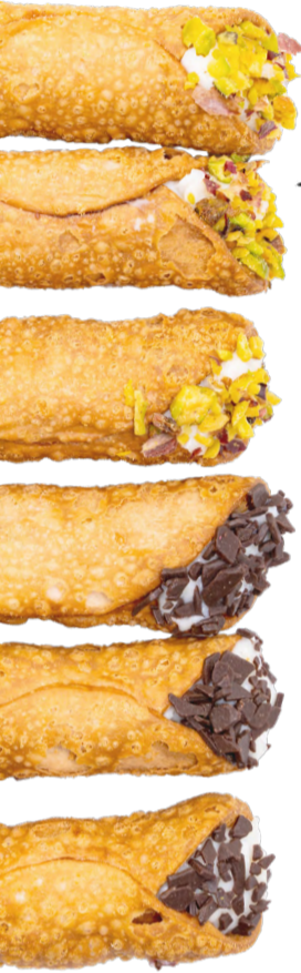
Mini cannoli siciliani

MILLEFOGLIE CIOCCOLATO E ZABAIONE 4,8 Millefoglie di pane Guttiau con mousse al cioccolato fondente*, crema allo zabaione* e zucchero velo