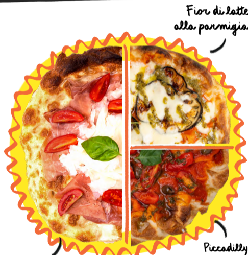
Fior di latte alla parmigiana