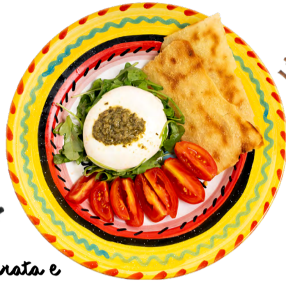
Burrata e Guttiau