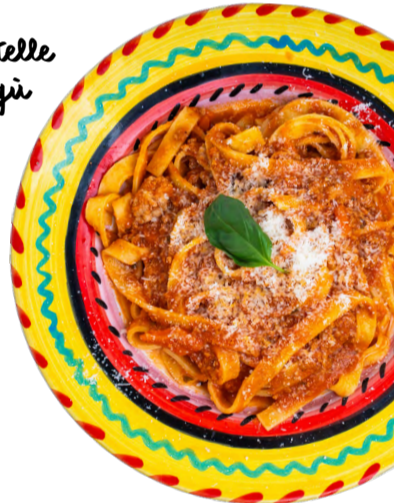
Tagliatelle al ragù