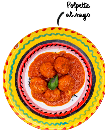
Polpette al sugo