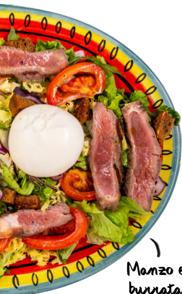
Manzo e burrata